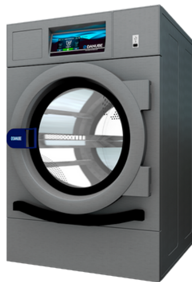
• DPR-ET2 de 8 et 10 kg

Les séchoirs DPR-8/10 complètent idéalement la blanchisserie des petites structures équipées des laveuses professionnelles WPR-8/10. Equipés du contrôle ET2 entièrement programmable, ses cycles de séchage sont efficaces pour garantir le bon stockage des franges après séchage.