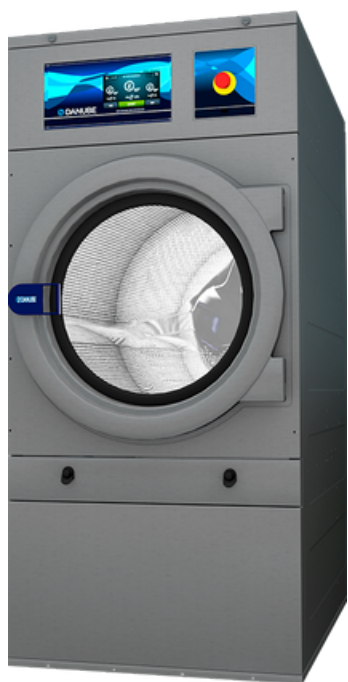
• DD - GOLD et SILVER de 11 à 35 kg

La gamme GOLD est la plus performante car elle est équipée, de série, de toutes les options possibles en terme d'économie d'énergie.