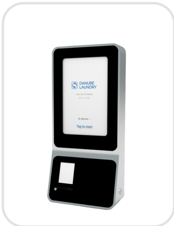
• DANUBE LAUNDRY KIOSK 12