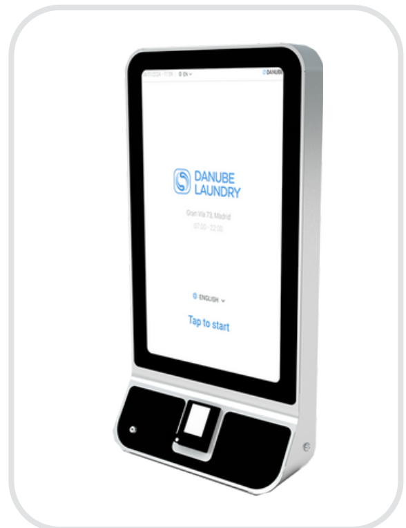
• DANUBE LAUNDRY KIOSK 32